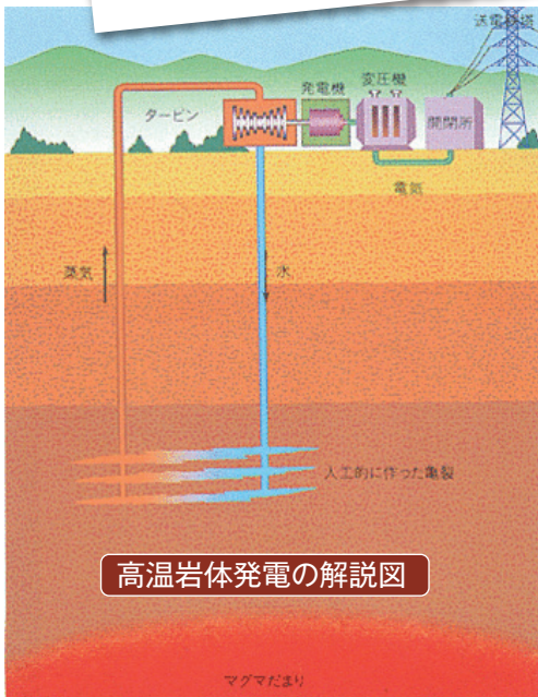
高温岩体発電の解説図

電は、今、米国、EUで実用化が大規模に始まっている。地球は中心の核で6千度そして百m掘り進むごとに3度以上温度上昇します。地球は熱エネルギーの惑星なのです。世界的に有名な「上総掘り(かずさぼり)」という井戸掘りの高い伝統技術を持つ我が県は、高温岩体発電の利便拡大、技術開発推進に向けて、広報、調査、技術開発など貢献すべきと思うが、どうか。 坂本副知事 議員御指摘の高温岩体発電は、将来における有力なエネルギー源です。本県としても情報提供、啓発、いろんな面で貢献してまいります。