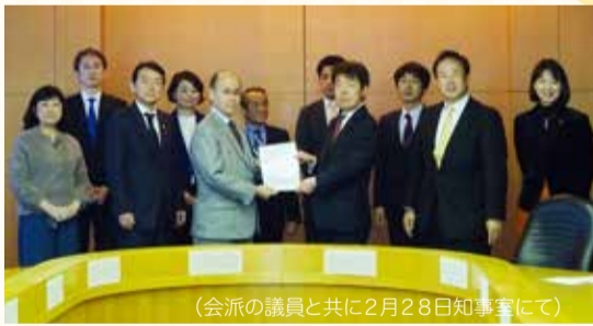
(会派の議員と共に2月28日知事室にて)